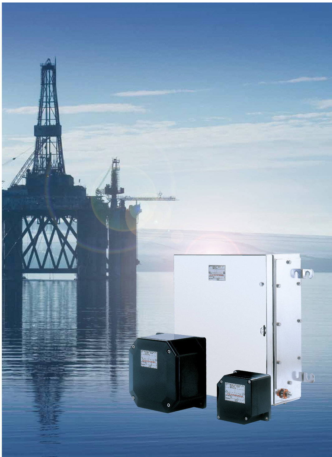
Abb. 1: Die HAWKE Gehäuselösungen sind bei vielen Projekten mitunter verbindlich vorgeschrieben – also fast schon Industriestandard.

Wenn es um elektrische Verteilungsaufgaben in explosionsgefährdeten Industriebereichen geht, kommt keiner an HAWKE vorbei. Sei es in der Öl-, Gas- oder chemischen Industrie, im Maschinen- und Anlagenbau, in der Antriebstechnik, in der Bio- und Pharmaindustrie oder in