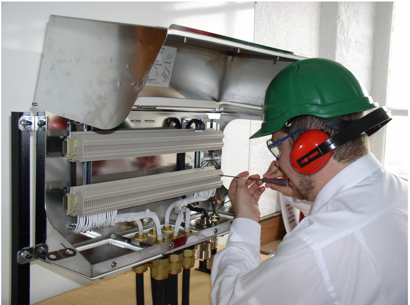
Abb 2.: Anwendungsbeispiel: HAWKE Edelstahlgehäuse wird verdrahtet.

Alle Gehäuse gibt es unterschiedlichsten Größen und in hunderten von Ausstattungs- und Konfigurationsvarianten. JACOB konfiguriert die HAWKE Ex-Gehäuse in zwei Varianten. Entweder aus VA Edelstahl (S-Serie) oder alternativ aus glasfaserverstärktem Polyester (PL 6 & 7 Serie).