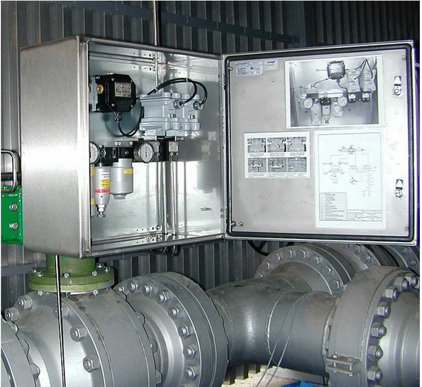
Abb. 3: Anwendungsbeispiel Direktgas Antriebssystem. HAWKE Kunststoffgehäuse in einem Edelstahlgehäuse montiert.

besitzen alle relevanten Zulassungen und Normen, z.B. nach ATEX und IECEx.