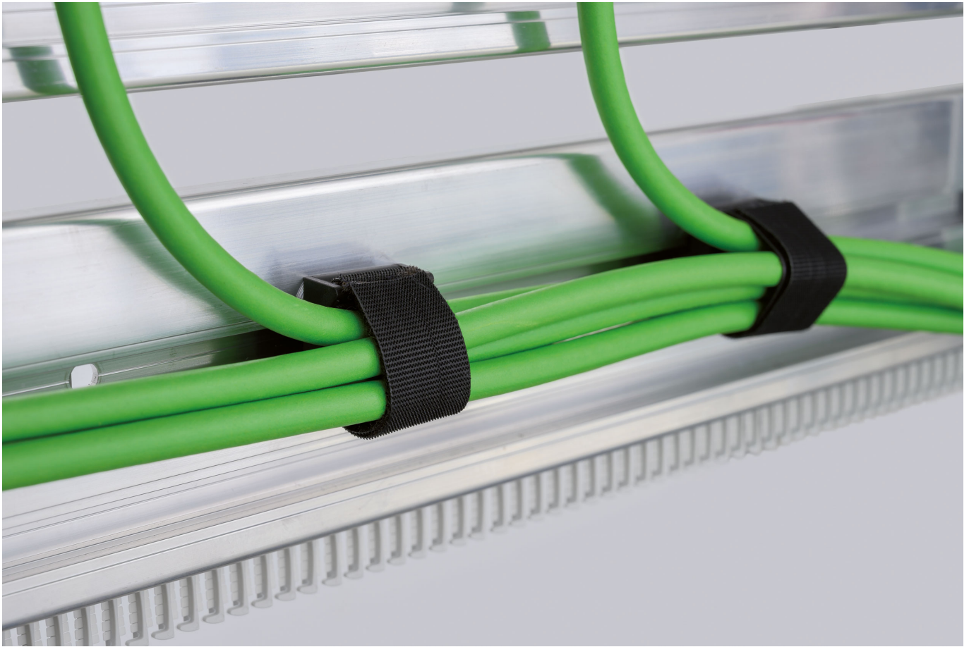
Abb. 2: Für eine gezielte horizontale Verlegung von Daten- und Steuerleitungen